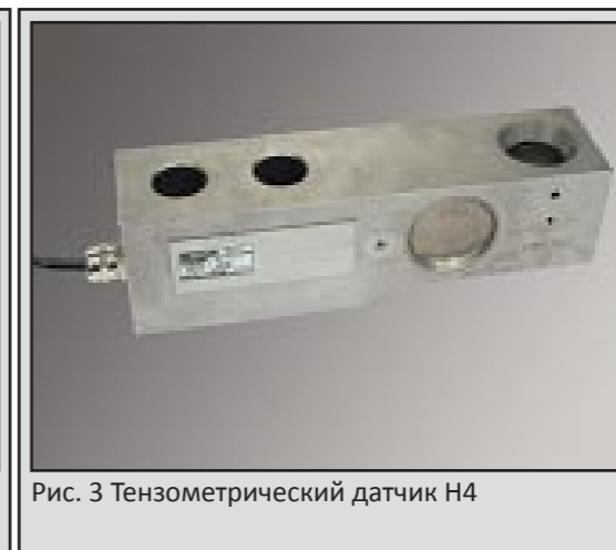
Рис. 3 Тензометрический датчик Н4