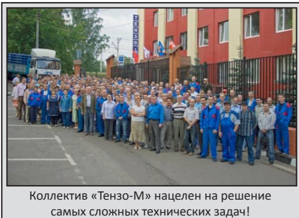
Коллектив «Тензо-М» нацелен на решение самых сложных технических задач!

Несмотря на мобильность весов «Фермер» весоизмерительный преобразователь ТВ003/05Н имеет все необходимые интерфейсы для связи весов с электрон-