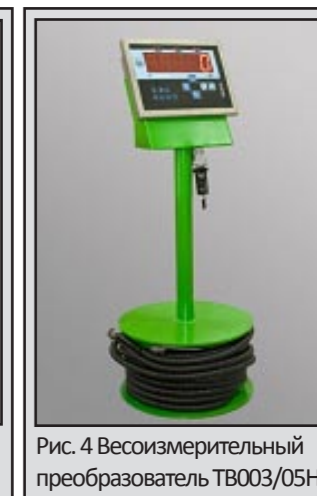
Рис. 4 Весоизмерительный преобразователь ТВ003/05Н

ными системами учета (Рис. 4). При необходимости к нему может быть подключен компактный модуль беспроводной связи по каналу «Bluetooth» для обмена данными с электронными устройствами — компьютером, ноутбуком или коммуникатором.