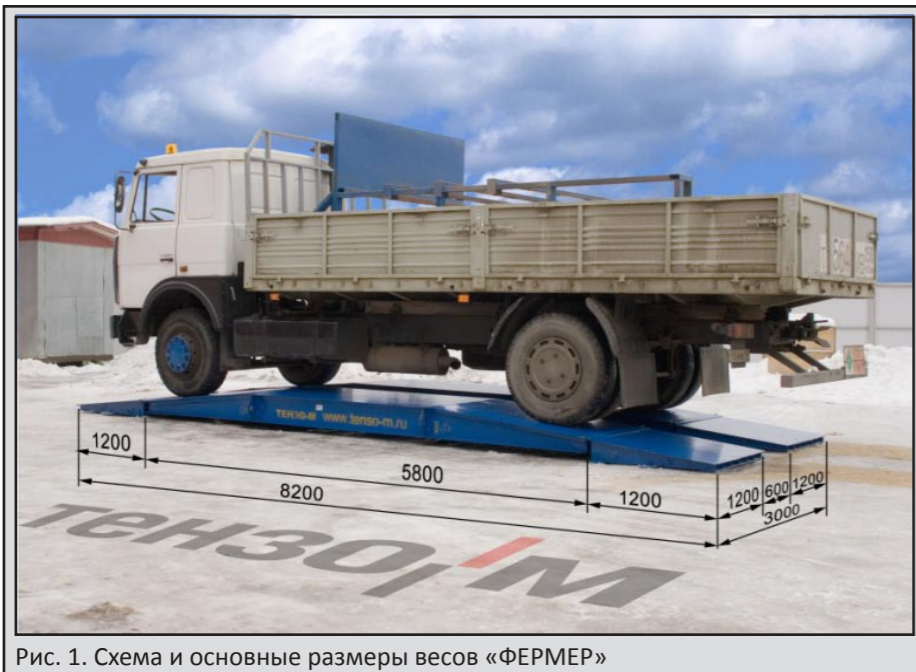
Рис. 1. Схема и основные размеры весов «ФЕРМЕР»