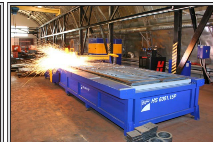
Рис. 6 Новые технологии в производстве весов «ФЕРМЕР»