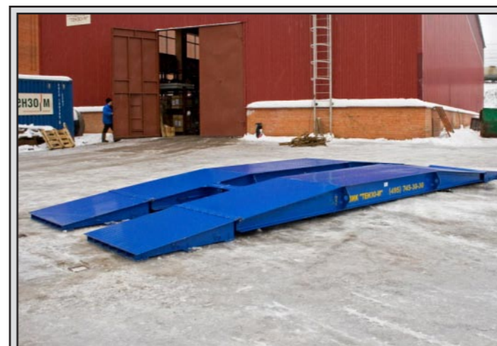
Рис. 5 Сборка весов на месте эксплуатации